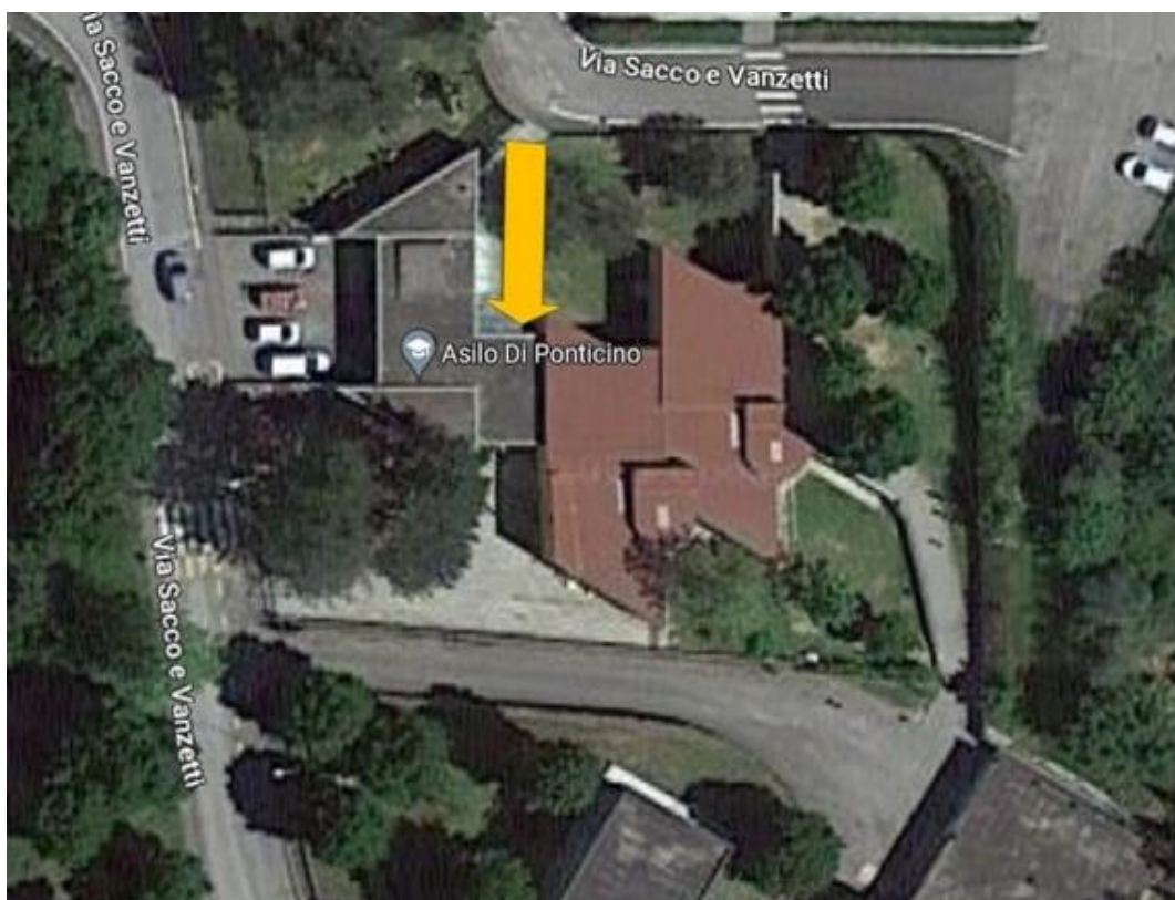
Ingresso Scuola Infanzia - Ponticino

Gli alunni, accompagnati dai propri genitori, faranno ingresso nei locali del nuovo plesso alle ore 8.10, seguendo il percorso sottoevidenziato e saranno prelevati dalle insegnanti.