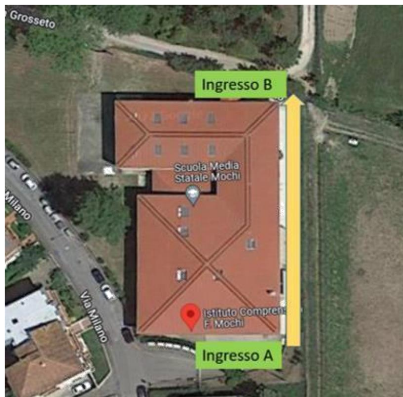
Ingressi Istituto Comprensivo "F. Mochi" - Levane

Nei giorni successivi l'ingresso delle classi 2A, 3B, 1A e 3A avrà luogo dall'ingresso B, sul retro della scuola, raggiungibile secondo il percorso indicato in figura e l'ingresso delle classi 3E, 2E, 1E, 1B e 2B avrà luogo dall'ingresso A.