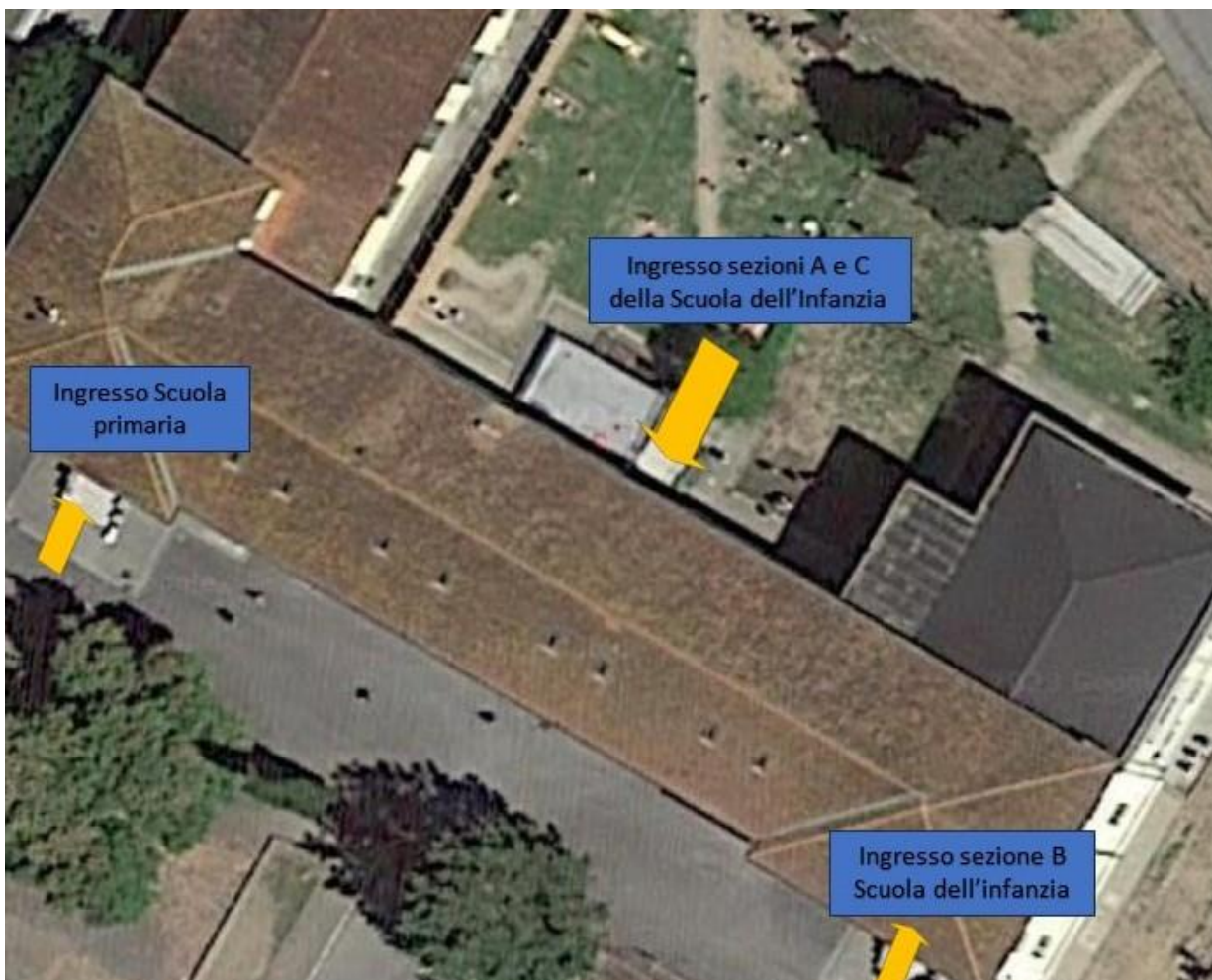
Ingressi Scuola Infanzia e Scuola Primaria - Levane

Ingresso dal portone del resede posteriore sez. A e C